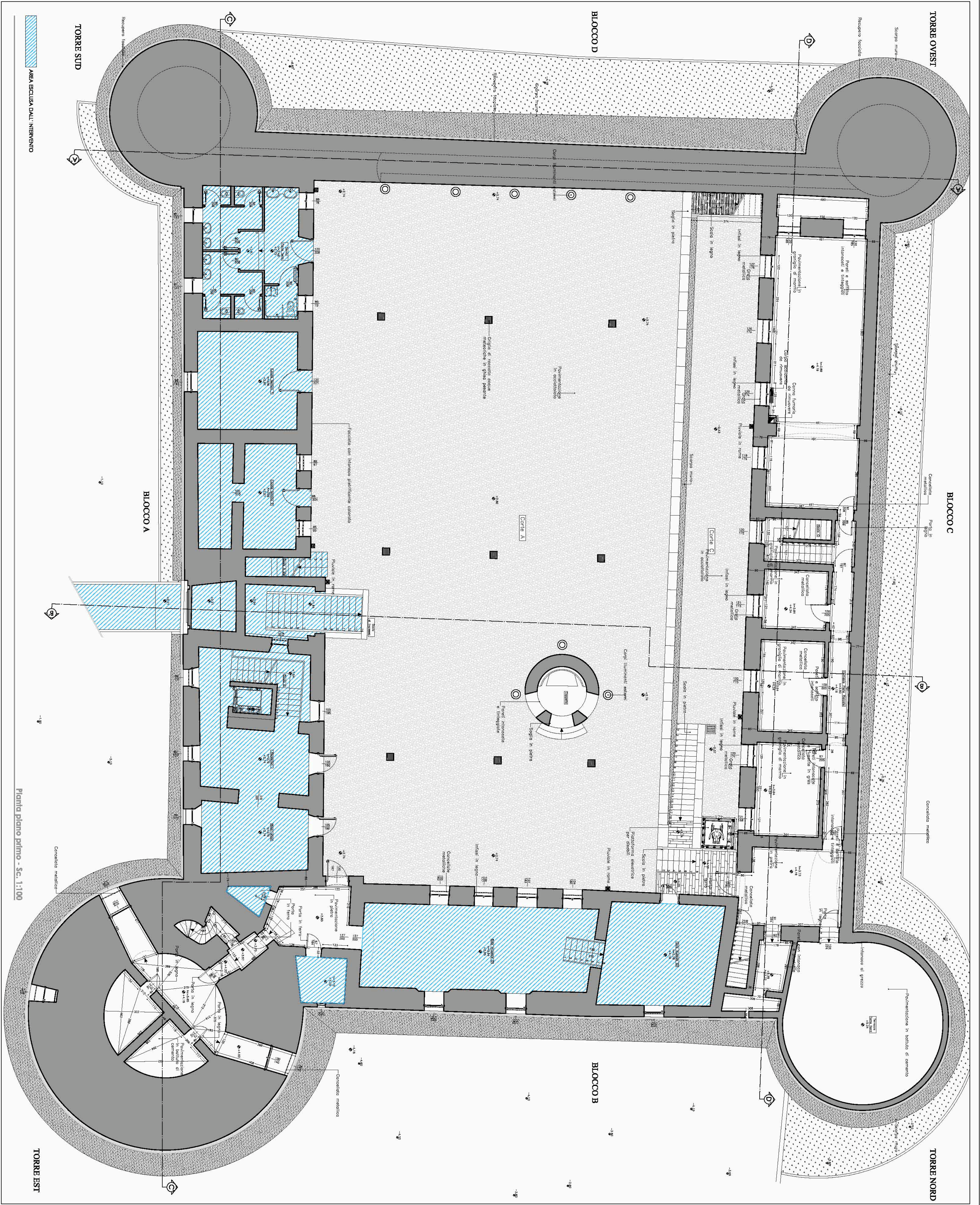
Pianta piano primo - Sc. 1:100